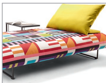
Kissige Optik auf filigranen Kufen Frei im Raum Platzierbar