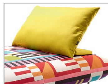
Frei positionierbare Funktionskissen Moba in verschiedenen Größen